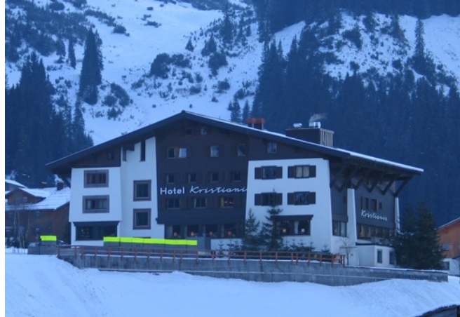
LSSunbeam Kristiania, Lech 2006, Signalfarbe, Betonstein

* 1952 in Brooklyn, NY, USA lebt und arbeitet in New York